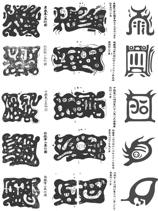
图一 五岳真形图的各种样式

围的地形所绘。《太平广记》卷三引《汉武帝内传》：“帝问此书是仙灵方耶。不审其目。可得瞻盼否。王母出以示之曰。此五岳真形图也。昨青城诸仙。就吾请求。今当过以付之”，“诸仙佩之。皆如传章。道士执之。经行山川。百神羣灵。尊奉亲近” ① 。《抱朴子内篇校释》：“上士入山，持三皇内文及五岳真形图，所在召山神，及按鬼录，召州社及山卿宅尉问之，则木石之怪，山川之精，不敢来试人。” ② 由此可见，五岳真形图是依据五岳俯视图所绘，是道士巡游山中的护身地图，历史悠久，至少可以追溯到汉魏时期。