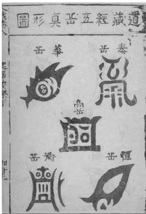
图二 道藏所刊五岳真形图

年) 正统刊本《道藏·洞玄部·灵图类》记载的《洞玄灵宝五岳古本真形图》，另一个是明万历二年(公元1574年)所刻的“五岳真形图碑” ① 。两个不同版本的五岳真形在图形并无太大出入，而是每个图形对应的山岳却有错位，南岳、西岳和北岳的图形有互换。从考古上来看，宋代五岳真形铜镜上的图案和明清时期的出土图案一致，这说明五岳真形最晚在宋代以前已经演变成现行版本，不过宋代铜镜上每个图案代表哪一山岳并没有说明 ② 。据考证来看，古本五岳真形要早于五岳真形图碑 ③ 。