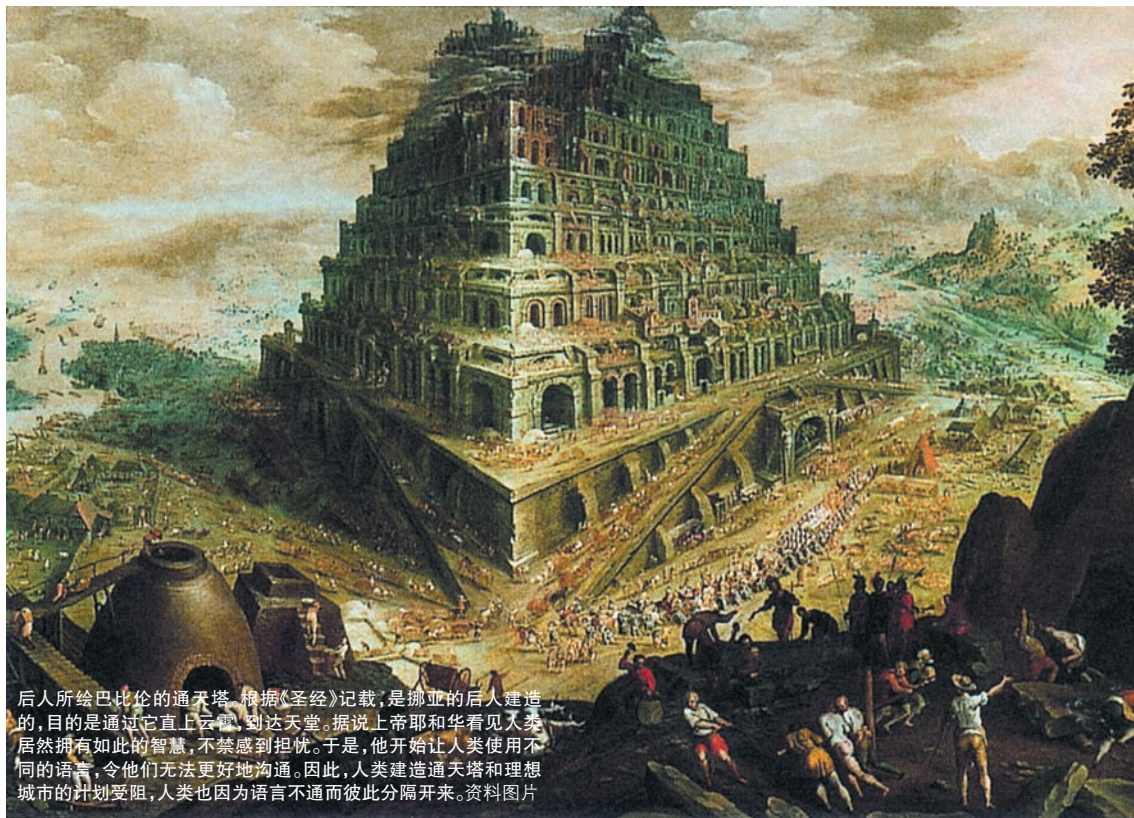
后人所绘巴比伦的通天塔。根据《圣经》记载，是挪亚的后人建造的，目的是通过它直上云霄，到达天堂。据说上帝耶和华看见人类居然拥有如此的智慧，不禁感到担忧。于是，他开始让人类使用不同的语言，令他们无法更好地沟通。因此，人类建造通天塔和理想城市的计划受阻，人类也因为语言不通而彼此分隔开来。资料图片