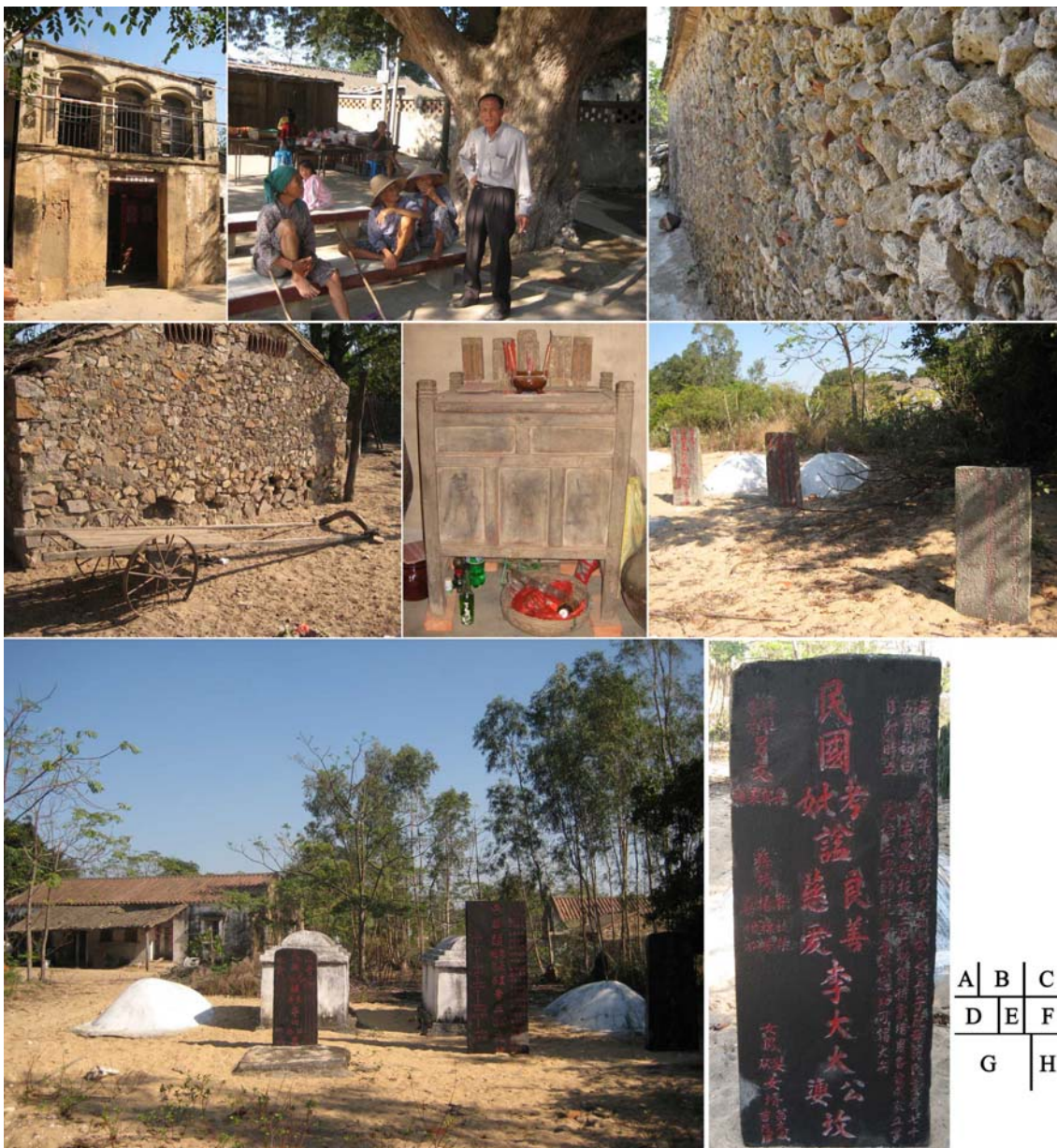
图 2 仵隆人的村落和墓葬 A.新街镇上的老房子；B.酸角树下乘凉的老人；C.珊瑚礁墙；D.牛车；E.屋里的祖先供桌；F.符家院子里嘉庆年间的墓葬；G.李家院子里的墓葬；H.李家的一块墓碑。

封土的规模都很小，连一个人平躺的长度都不够。原来仵隆人是采用捡骨葬的风俗的。人死后先草葬，等数年以后再挖出骸骨。那时尸体腐烂殆尽，只剩白骨，收拾放入石